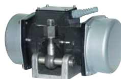
NEG / NEH